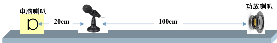
(a) 作品基本部分 (4) 的测试

(7) 作品要求 (4)、(5) 和 (6) 的指标测试，使用电脑 USB 喇叭 (功率不超过 1W) 播放音乐作为信号源，放置在距麦克风 20cm 的位置。具体测试的框图如图 2 所示。